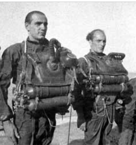
Пловцы группы «Гамма»