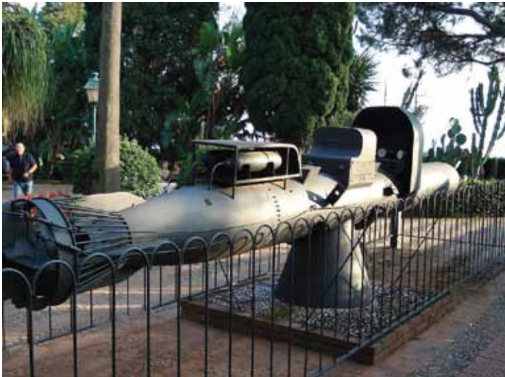
«Майале» (итал. Maiale) – человекоуправляемая торпеда, специальное оружие ВМС Италии периода Второй мировой войны. Применялось подразделениями боевых пловцов (отряд 10-й флотилии MAS) для уничтожения военных кораблей и транспортных судов противника

вознаграждение от своего правительства они передали вдовам погубленных ими моряков.