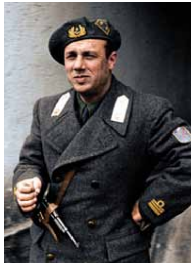
Юнио Валерио Шипионе Боргезе (1906–1974, с 1943 г. – командир 10-й флотилии MAS)