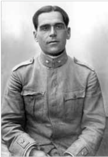
Raffaele Rossetti – морской инженер, полковник ВМС Италии, изобретатель человекоуправляемой торпеды. В 1918 г. использовал свое изобретение для подрыва австро-венгерского линкора «Viribus Unitis»