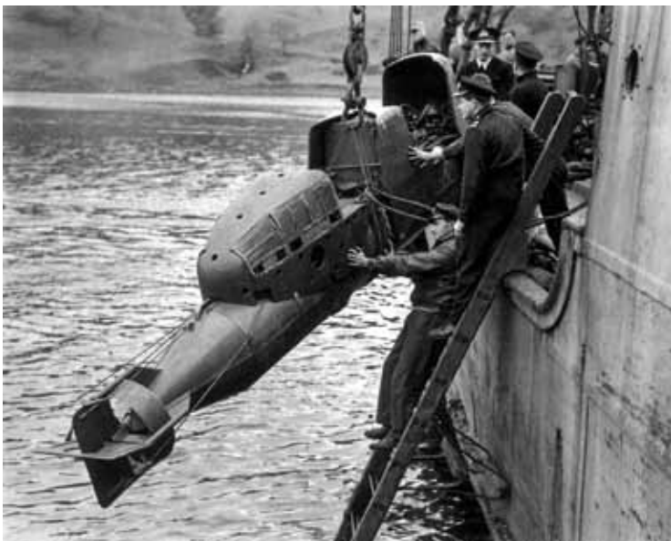
Буксировщик итальянских боевых пловцов

В Первую мировую войну Италия осуществила самую шумевшую и скандальную диверсионную операцию. Италия вступила в войну в 1915 году на стороне Антанты, однако при этом она намеревалась превратить Адриатическое море во «внутреннее море» Италии и организовать в одной из главных военно-морских баз Австро-Венгерской империи в городе Пуле специальную диверсионную операцию.