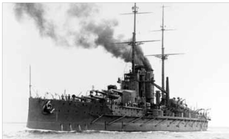
Линкор Viribus Unitis

Взрыв прозвучал в 6:44 утра 1 ноября 1918 года — на 14 минут позже установленного времени. Линкор переломился и стал стремительно погружаться в воду. Погибли около 400 офицеров и матросов. В числе погибших был и 46-летний Янко Вукович-Подкапельский, которому лишь одну ночь удалось побыть в статусе главнокомандующего Военно-морским флотом новой страны и в звании контр-адмирала. Россетти и Паолуччи остались живы и вернулись в Италию. Крупное денежное