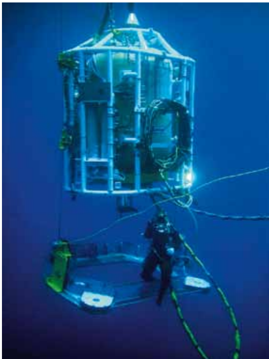
Промышленный водолаз: спуск в колоколе

хозяйства. Подобного в новейшей водолазной российской истории еще не было — обычно мы безнадежно отставали от других! И такая ситуация сложилась благодаря активной позиции Ассоциации «Национальное отраслевое объединение подрядчиков подводно-технических работ» (в прошлом — некоммерческое партнерство «Ассоциация водолазов»), претерпевшей в 2019 году ряд существенных изменений, включая коррек-