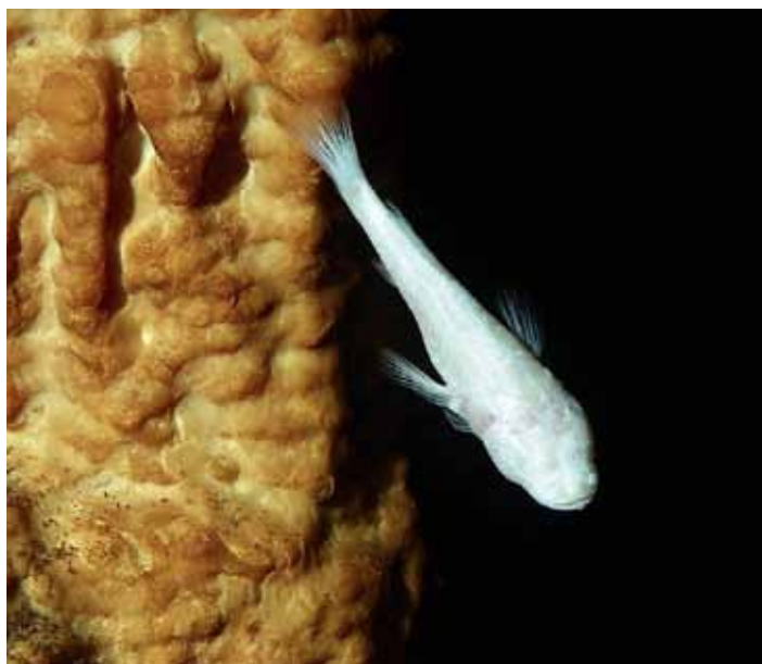
Слепая рыбка-альбинос (пещера Али-Бабы)

мне ее для исследования дыры в скале, которую они нашли год назад в буше. Я назвал этот колодец «Дымовой трубой».