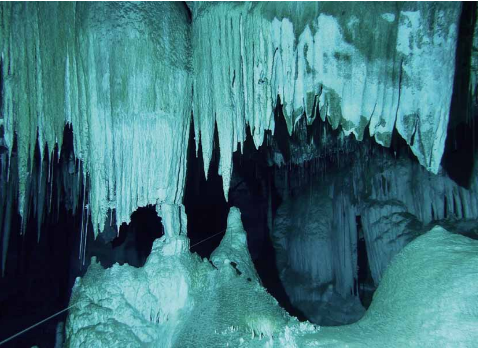
Органнe Трубы и Круглое окно. Пещера Али-Бабы, 2017 г.