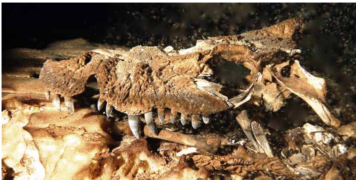
Еще один череп карликового рогатого крокодила в пещере Гаргантюа, 2016 г.

исторических временах — о миллионах лет! — это просто потрясающе. Как в Зазеркалье Алисы, это и окно в палеонтологию, глазок, в который можно подсмотреть, какая жизнь кипела здесь когда-то, это живой музей естественной истории. И он доступен только некоторым избранным, тем, кто способен переступить через страх. Это требующий усилия душевный подвиг, который мало-помалу растит в душе уверенность и твердость, и в результате оказывается вознагражден. «Да ты чокнутый!» — говорят мне иногда. Да, безумие, но — должен уточнить — безумие контролируемое.