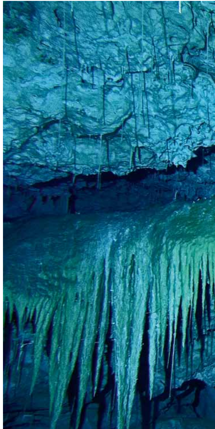
Phallus impudicus в пещере Али-Бабы

После долгого дня, проведенного на песчаных пыльных дорогах, я встречаюсь с гидом из племени Микеа. Здравый смысл подсказывал мне избегать как деревенского фоконтани, так и безумного колдуна — наверняка меня сглазит. План «А» был — погрузиться в пещере Гаргантюа и исследовать сужение с низким потолком на глубине 14 м, до которого я дошел в прошлом году. Этот трюк мне удался — я там протиснулся боком. После него тоннель резко расширялся с заметным наклоном влево и подходил к Т-перекрестку, где разделялся на 2 хода, шедших под острым углом друг к другу. Здесь глуби-