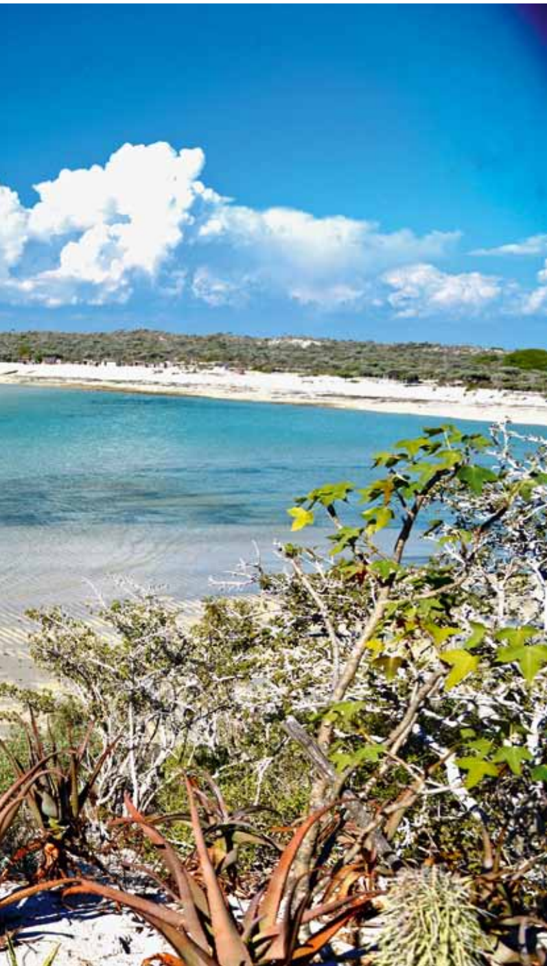
С видом на Мозамбикский канал

в VII в. н.э. этот вид вымер. Несколько месяцев спустя, в 2013-м, в одном из сенотов плато Махафали я вытащил из воды нижнюю челюсть карликового гиппопотама.