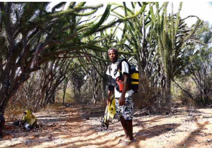
Саме со снарягой на фоне эндемичных лесов Мадагаскара

очень доволен, вечером займусь описанием проведенных погружений.