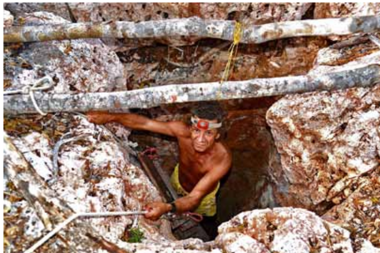
Автор спускается в Колодец-дымоход

С сентября 2015 г. я начал исследование новой для себя территории — плато Беломотра, к северу от Тулеара. Это отдаленный район с карстовыми воронками и пещерами, промытыми в эоценовых известняках. Местность очень засушливая, с колючим бушем, где среди какту-