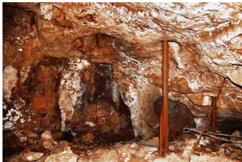
Зал внизу Колодца-дымохода с корнями деревьев

В 2015 году я нашел замечательную пещеру, которую сразу окрестил пещерой Али-Бабы. Добраться до нее можно только пешком, по песчаной тропе через буш, таща всю снарягу на себе. Мало заметная узкая щель в извест-