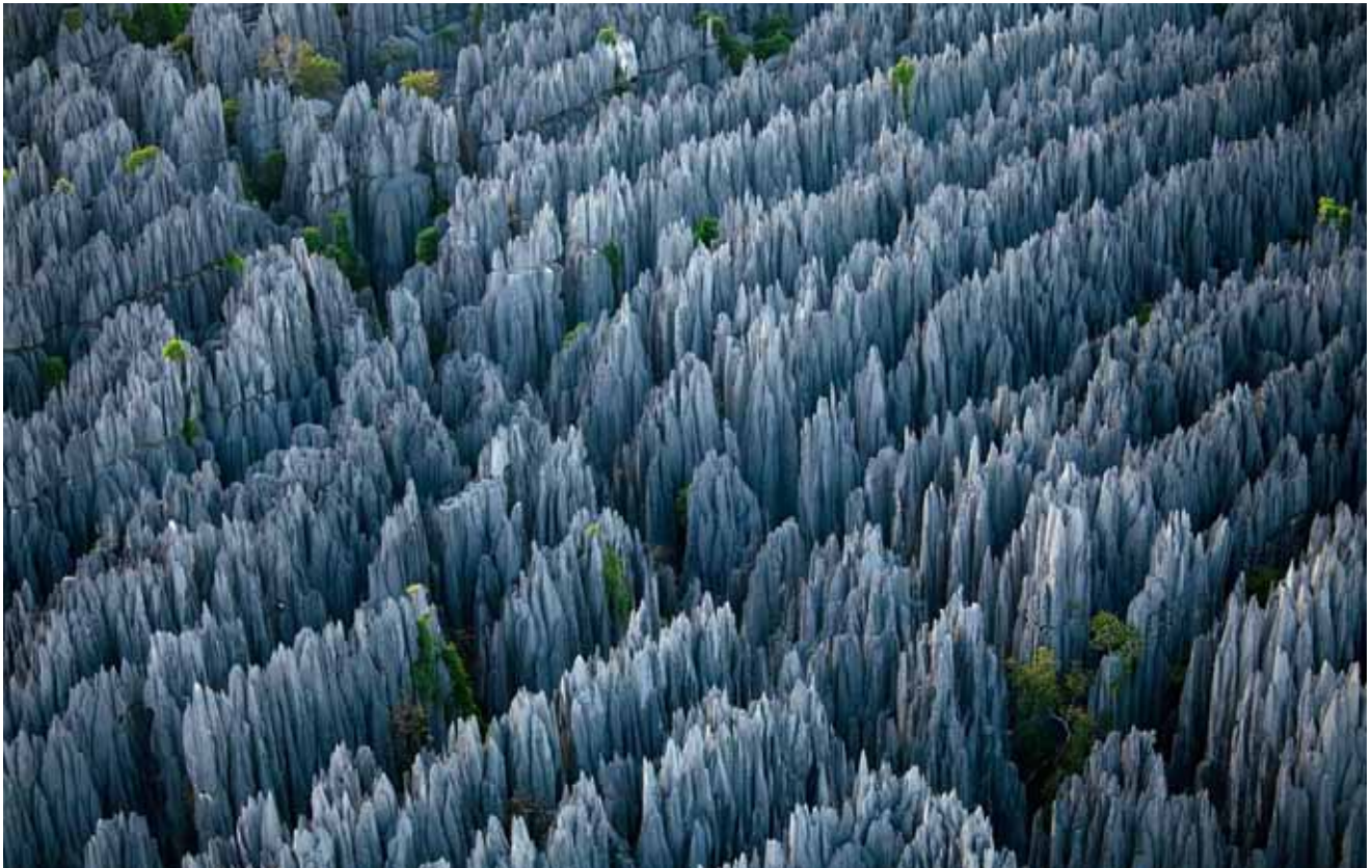
Каменный лес Цинги-де-Бемараха – карстовый заповедник на западном побережье острова