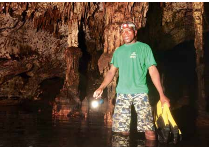
Саме встречает меня после погружения в пещере Али-Бабы

нях — вход в это подземно-подводное царство. Чтобы проникнуть в него, сгибаешься в три погибели — очень низкий потолок — и протискаешься внутрь. Тьма крошечная, под ногами — скользкий склон, спускающийся в фантастический зал, полный сталактитов, сталагмитов и дантовских монументальных пилонов — прямо подземный кафедральный собор... Здесь, на глубине 15–20 метров под землей, среди колонн лежит подземное озеро. Воздух в пещере такой жаркий и влажный, что очень быстро покрываешься потом. Дышать очень тяжело, как в сауне. В темноте вокруг снуют летучие мыши, по заросшему гуано полу бегают тараканы.