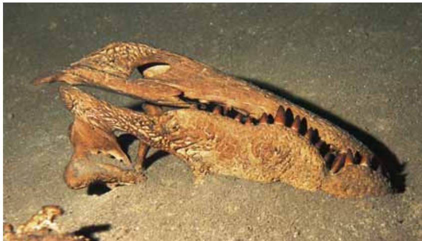
Череп рогатого крокодила с красными зубами. Пещера Гаргантюа, 2016 г.

От меня потребовали взять с собой в пещеру колдуна для проведения ритуала «фомба» — молитвы к духам пещер. Для молитвы были нужны бутылка рома и несколько пачек табака.