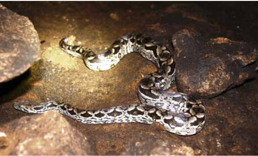
Встреча с боа Дюмерила в пещере Али-Бабы

снарягу — подвеску X-Deer, шланги Махфлех... Даже купил себе желтый шлем с резервным фонарем, хотя напоминаю в нем престарелого клоуна, отправившегося в крестовый поход.