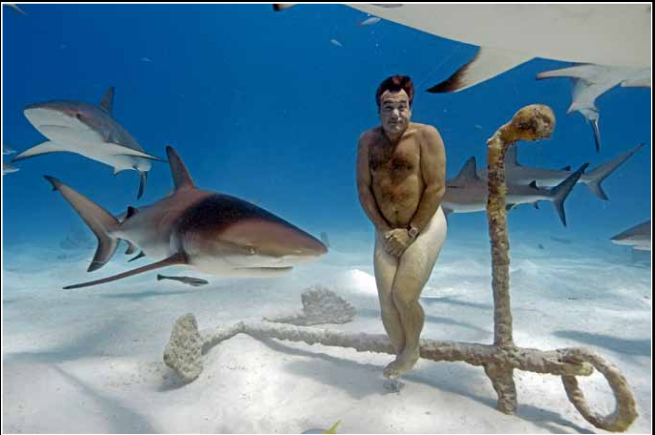
Автопортрет с акулами