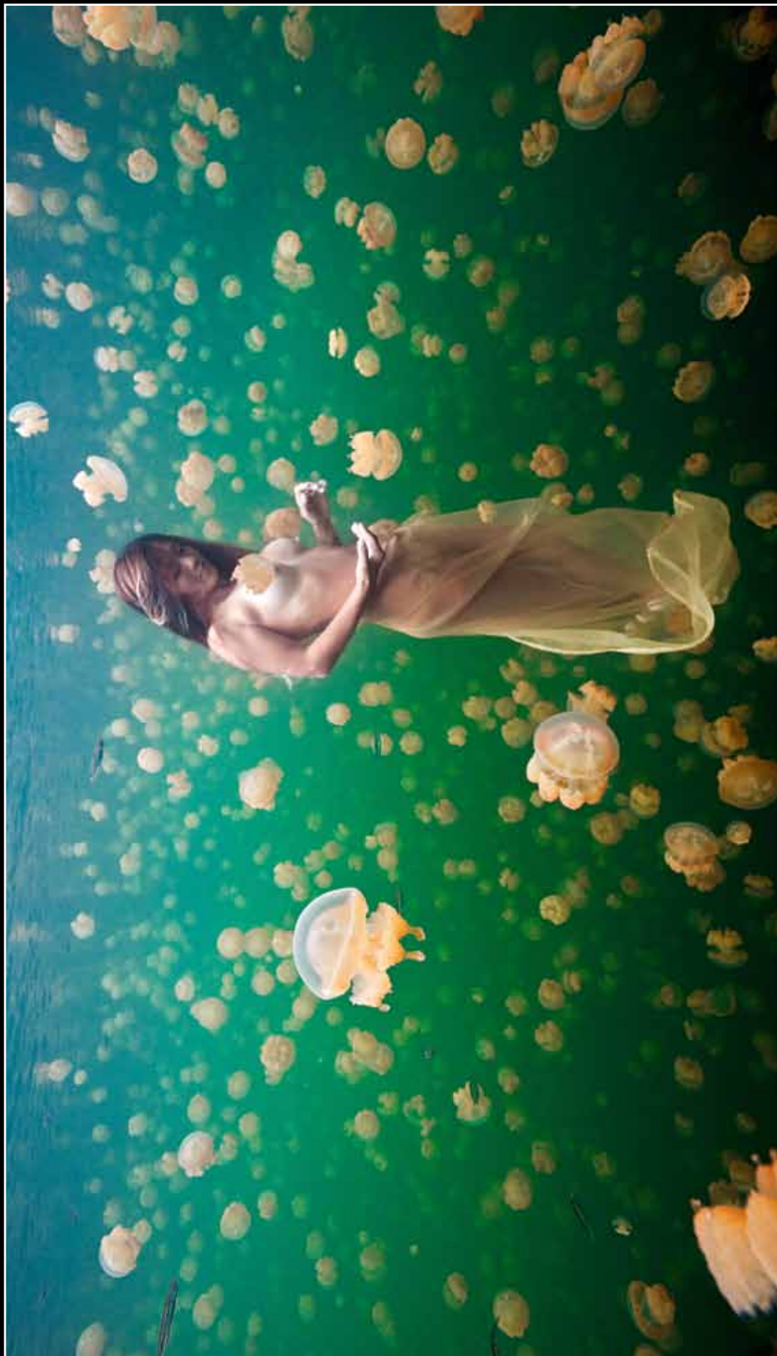
Богиня в облаках