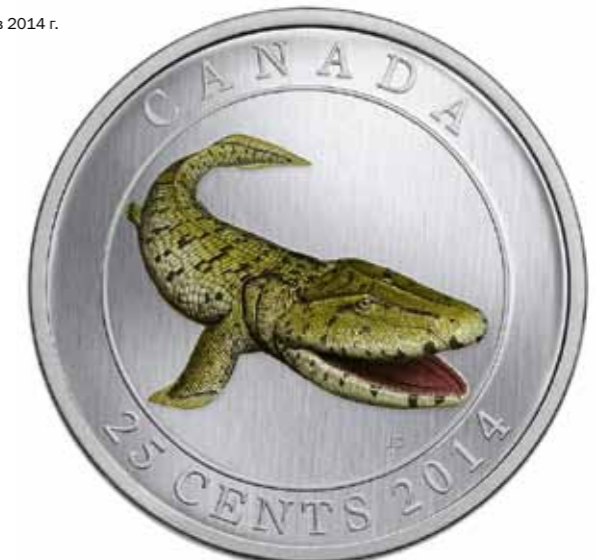
Канада. 25 центов 2014 г.

А его пока единственное «денежное» изображение известно с 1981 г., когда Стуршёнское чудовище украсило собой одну из шведских сувенирных монет.