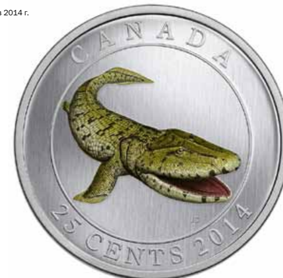
Канада. 25 центов 2014 г.

А его пока единственное «денежное» изображение известно с 1981 г., когда Стуршёнское чудовище украсило собой одну из шведских сувенирных монет.