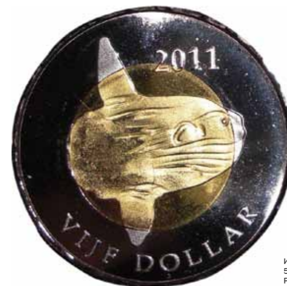
Илл. 8. Синт-Эстатиус. 5 долларов 2011 г. Рыба-луна (мола-мола) (сувенирная монета)

В Китае это Тяньчи, или Небесное озеро, расположенное в кратере вулкана Пэктусан, а также озеро Канас.