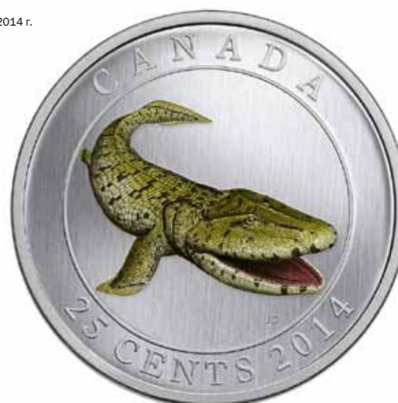
Канада. 25 центов 2014 г.

А его пока единственное «денежное» изображение известно с 1981 г., когда Стуршёнское чудовище украсило собой одну из шведских сувенирных монет.