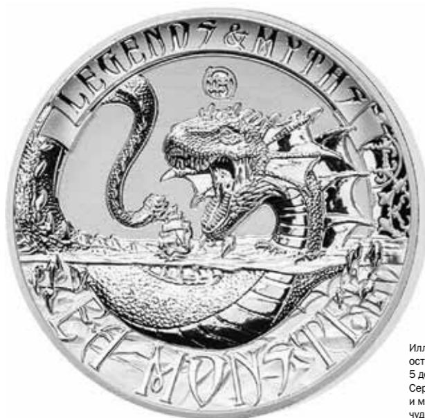
Илл. 7. Соломоновы острова. 5 долларов 2017 г. Серия «Легенды и мифы». Морское чудовище

морского дьявола ( Raja binoculata ) или рыбы-луны ( Mola mola ). Отдельные экземпляры последней, как известно, достигают впечатляющих размеров. Так, в 1908 г. недалеко от Сиднея была выловлена рыбина длиной в три и высотой в четыре с лишним метра! Весила она более двух тонн и двухсот килограммов! Торчащий из воды плавник такой великанши и в самом деле легко принять за спинной гребень или ласту гигантского морского чудовища.