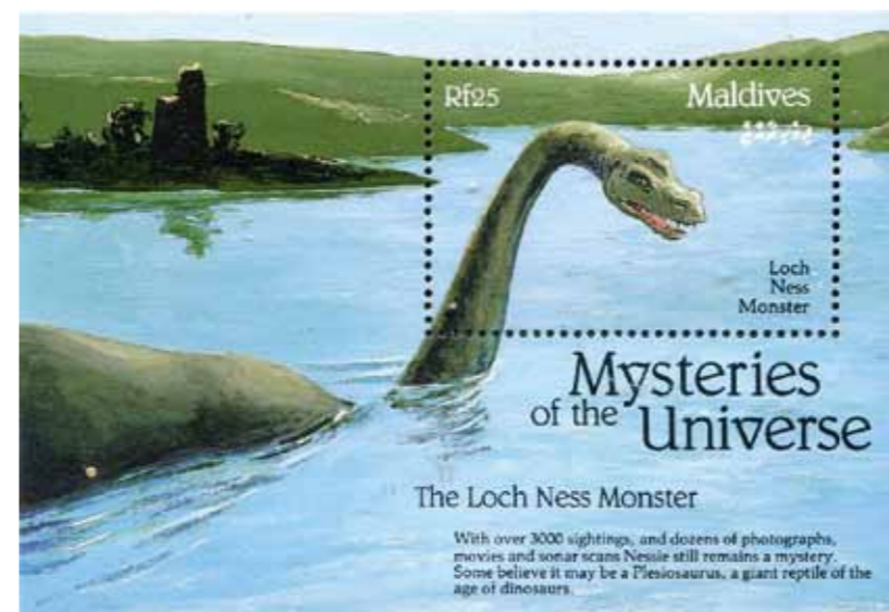
Илл. 2. Мальдивские острова. 1992 г. Лох-Несское чудовище

Существует великое множество дензнаков и почтовых марок, посвященных обитателям подводного мира. И не проходит месяца, чтобы