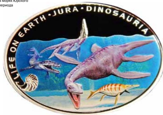
Илл. 6. Ниуэ. 1 доллар 2013 г. В морях Юрского периода

морского дьявола ( Raja binoculata ) или рыбы-луны ( Mola mola ). Отдельные экземпляры последней, как известно, достигают впечатляющих размеров. Так, в 1908 г. недалеко от Сиднея была выловлена рыбина длиной в три и высотой в четыре с лишним метра! Весила она более двух тонн и двухсот килограммов! Торчащий из воды плавник такой великанши и в самом деле легко принять за спинной гребень или ласту гигантского морского чудовища.