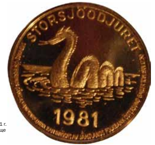
Илл. 9. Швеция. 1981 г. Стуршёнское чудовище (сувенирная монета)

Встречали озерных чудовищ и в США. Но, пожалуй, больше всего их в Канаде и Европе. В Европе, помимо Лох-Несса, это еще и озеро Лох-Ри (Ирландия), Лагарфльют (Исландия), Лавборо в графстве Лестершир (Англия).