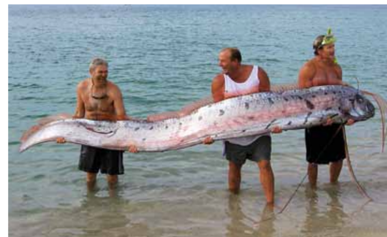
«Сельдяной король» (Regalecus glesne). Встречи моряков с гигантскими сельдяными королями послужили одной из основ для легенды о «морском змее»

Изображения шотландской криптоиды встречаются не только на почтовых марках. С ними знакомы и собиратели коллекционных монет. Так, Острова Кука в 2009 г. Лох-Несскому чудовищу посвятили одну из монет серии «Мифические создания».