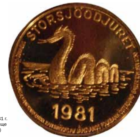
Илл. 9. Швеция. 1981 г. Стуршёнское чудовище (сувенирная монета)

Встречали озерных чудовищ и в США. Но, пожалуй, больше всего их в Канаде и Европе. В Европе, помимо Лох-Несса, это еще и озеро Лох-Ри (Ирландия), Лагарфльют (Исландия), Лавборо в графстве Лестершир (Англия).