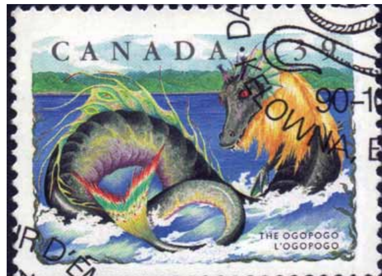
Илл. 11. Канада, 1990 г. Огопого

Не остался без внимания художников и «плезиозавр» озера Мемфремагог в Квебе-