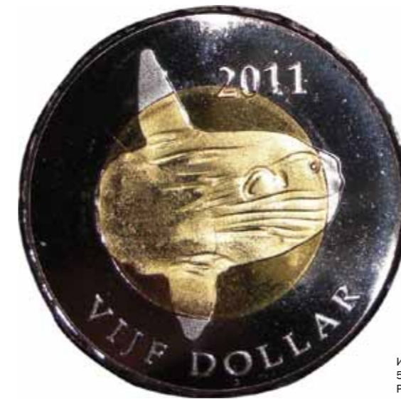
Илл. 8. Синт-Эстатиус. 5 долларов 2011 г. Рыба-луна (мола-мола) (сувенирная монета)

В Китае это Тяньчи, или Небесное озеро, расположенное в кратере вулкана Пэктусан, а также озеро Канас.