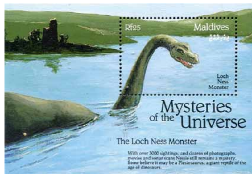
Илл. 2. Мальдивские острова. 1992 г. Лох-Несское чудовище

Существует великое множество дензнаков и почтовых марок, посвященных обитателям подводного мира. И не проходит месяца, чтобы