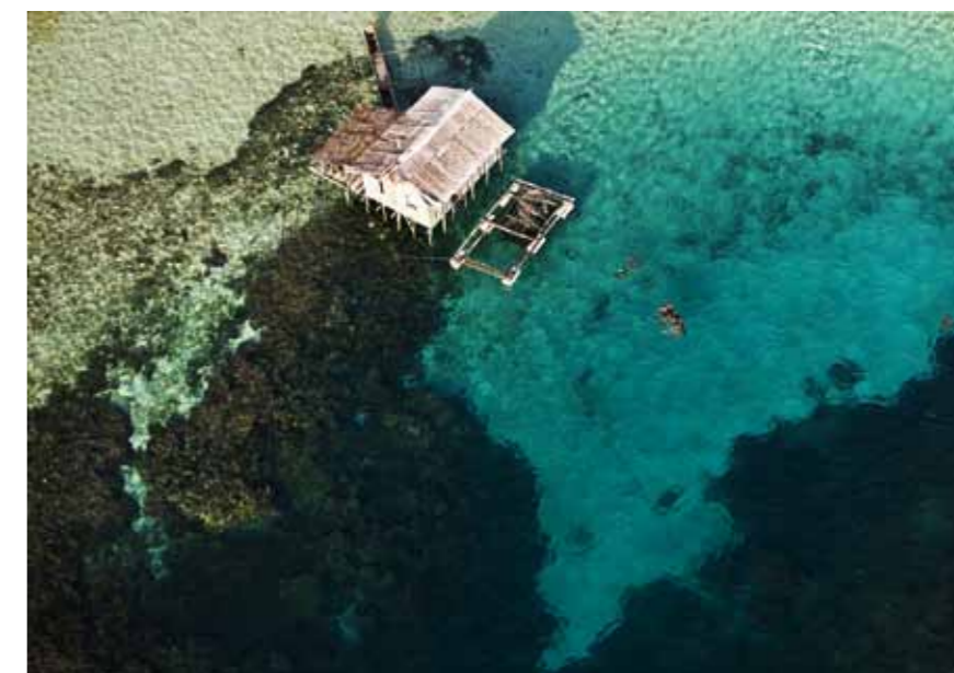
Кадр из фильма «Планета океан» (Франция, 2012)

Страна: Франция Год выпуска: 2012 Продолжительность: 94 мин Жанр: Документальный Режиссеры: Ян Артус Бертран, Мишель Пити