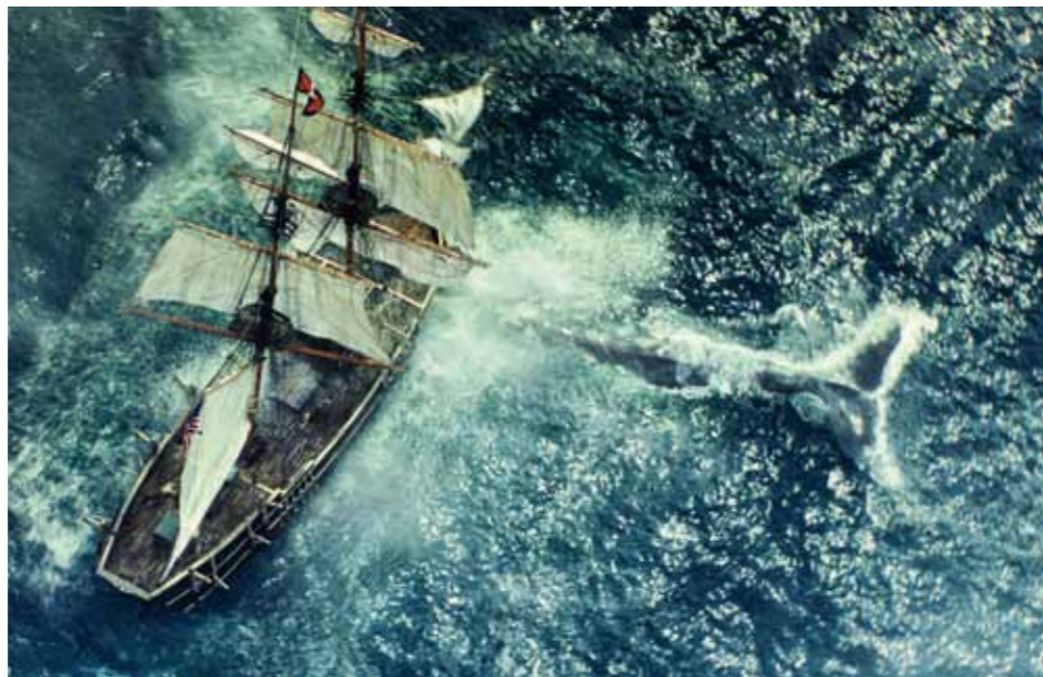
Кадр из фильма «В сердце моря» (США, 2015)

Лето, отпуск, дайвинг... А что, если не совпало? Есть альтернативный вариант «погрузиться». Предлагаем вам краткий обзор фильмов о «подводе», вполне вероятно, что некоторые из них вы еще не успели посмотреть. Приятного просмотра!