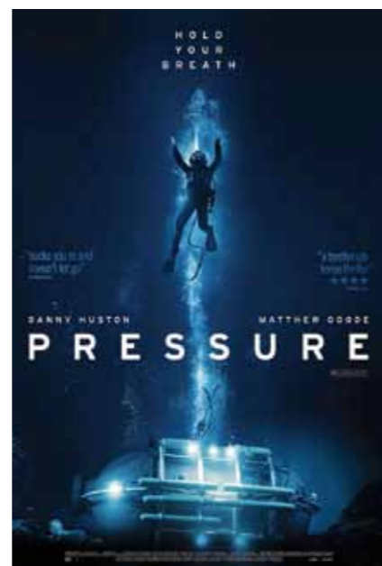
«Опасное погружение/Pressure» (США, 2015)