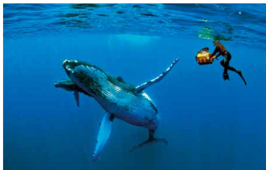
Кадр из фильма «Океаны» (2009)

Не считая «Оскара», полученного 7 марта 2010 года, в 2009–2010 гг. фильм также номинировался еще на 27 различных наград и выиграл 22 из них.