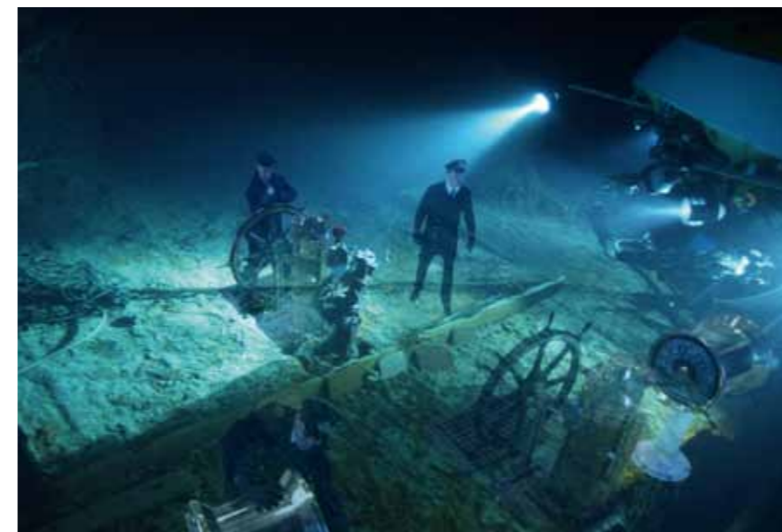
Кадр из фильма «Призраки бездны: Титаник» (США, 2003)

Страна: США Год выпуска: 2003 Продолжительность: 88 мин Жанр: Документальный Режиссер: Джеймс Кэмерон