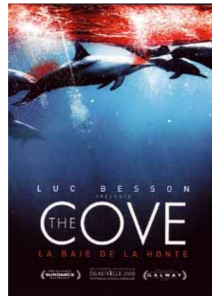
«Бухта» (Канада, США, 2009)

Любые способы повлиять на ситуацию не приносят успеха: местные власти, бесспорно, знают об