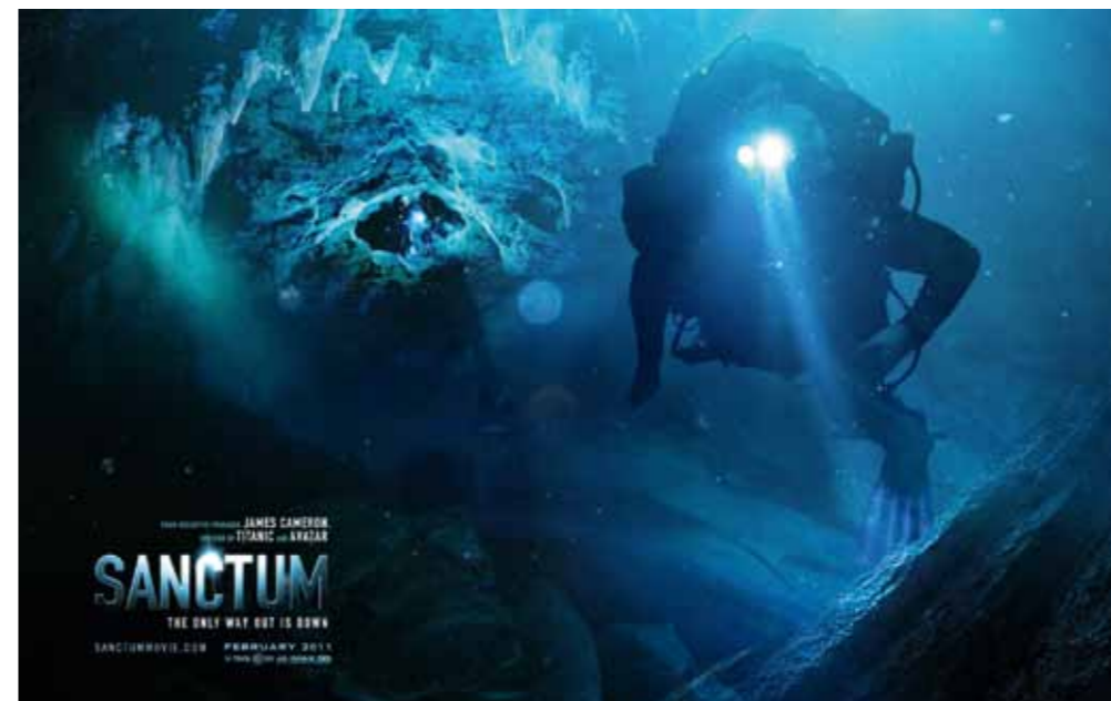
Кадр из фильма «Sanctum» (США, 2010)

Картина рассказывает о группе спелеологов, решивших исследовать одну из самых больших и разветвленных пещер на Земле. Во время пребывания их в пещере на