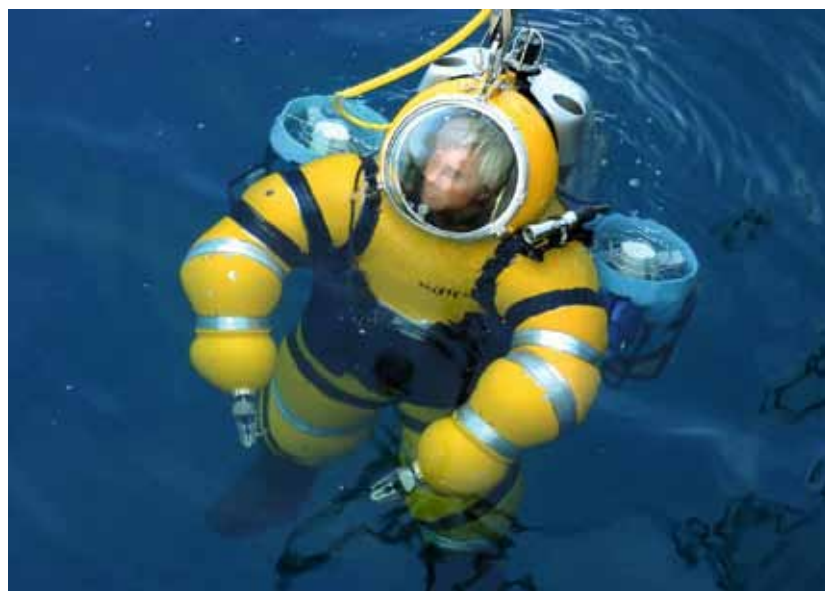
Гипербарический скафандр Newtsuit

Открытая в 1983 году Гестахтская имитационная система используется для исследования насыщенных погружений на глубину до 600 метров, а также для разработки методов организации подводно-технических работ.