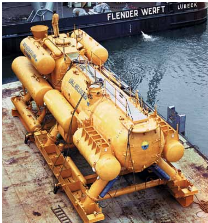
Подводная лаборатория «Helgoland», построенная фирмой Dräger в 1969 г.

Подводный комплекс «Гельголанд» был предназначен для работ в Северном море и рассчитан для работ на глубинах до 30 метров. При его создании была принята система обеспечения не с судов, а со специального энергобюя.