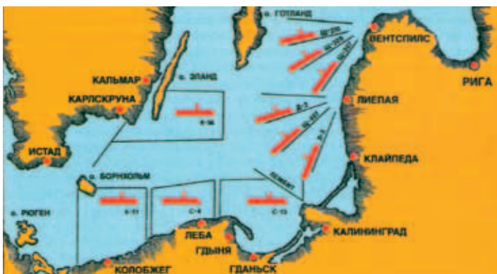
Позиции ПЛ БФ в 1944 году