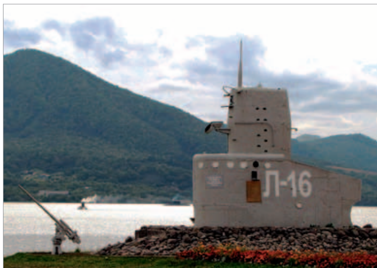
Мемориальный памятник ПЛ «Л-16» в Петропавловске-Камчатском

Таким образом, «Красногвардейцу» выпала честь стать первым в советском ВМФ гвардейским краснознаменным кораблем. Всего за годы войны «Д-3» совершила 10 боевых походов, потопив 10 вражеских кораблей и судов и два повредив. Выйдя в десятый боевой поход в кон-