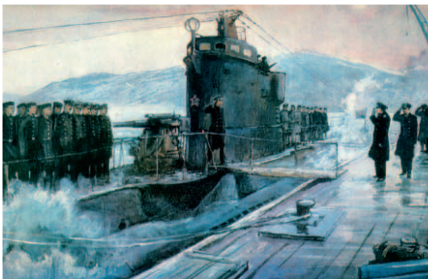
Гвардейская ПЛ «Д-3» возвращается с победой. Худ. П.П. Павлинов

К примеру, подводная лодка «Щ-211» уже в первые месяцы войны (15.08.1941) потопила румынский транспорт «Peles» — союзника фашистской Германии. Подводная лодка «М-111» под командованием Я.К. Иосселиани в период с ноября 1942