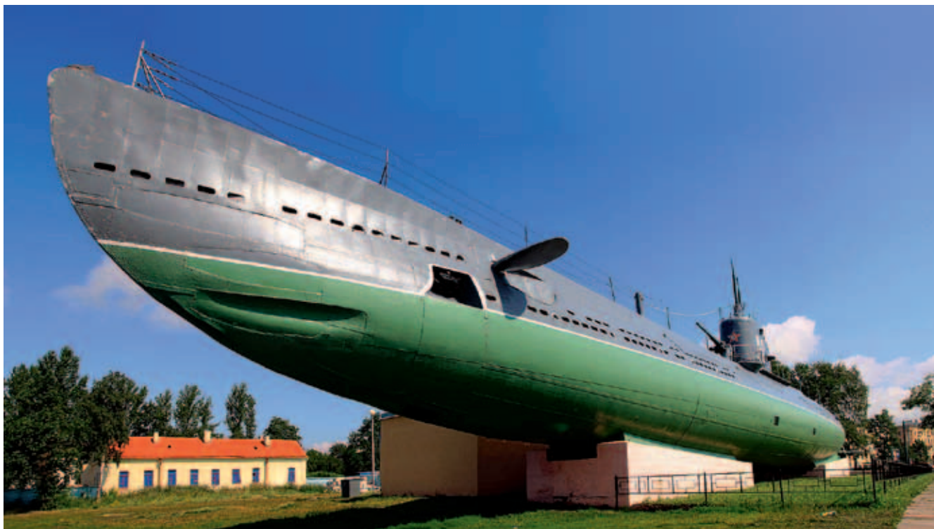
Подводная лодка-музей «Д-2» «Народоволец», г. Санкт-Петербург