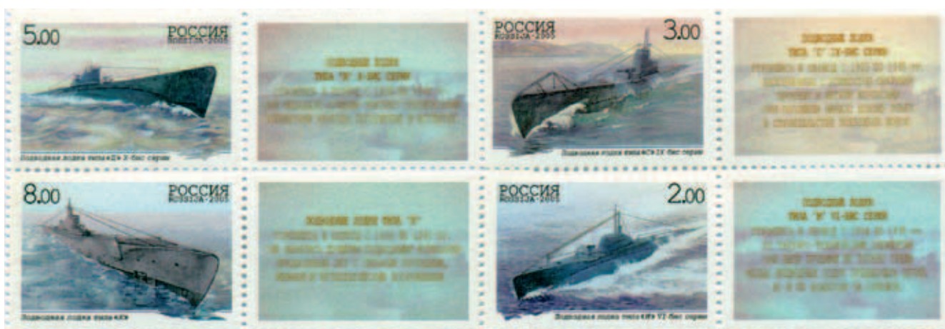
Почтовые марки России. Подводные лодки Великой Отечественной войны

Многим прославленным подводным лодкам были посвящены также почтовые открытки и конверты.