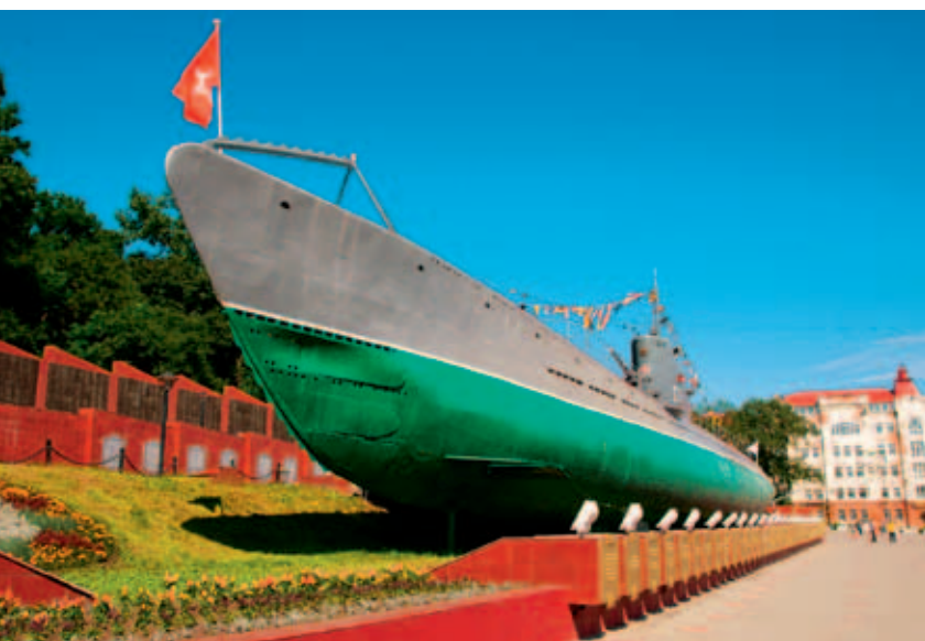
Гвардейская Краснознаменная ПЛ «С-56». г. Владивосток

Говоря о боевой деятельности подводных лодок Балтийского флота, следует отметить следующее. Подводники, действуя на коммуникациях врага, причинили значительный урон фашистской Германии. За годы войны 8 подводных лодок БФ были награждены орденами Красного Знамени и стали краснознаменными («К-52», «С-13», «Лембит», «Щ-307», «Щ-310», «Щ-320», «Щ-323», «Щ-406»), 3 ПЛ стали Гвардейскими («Л-3», «Щ-303», «Щ-309»).