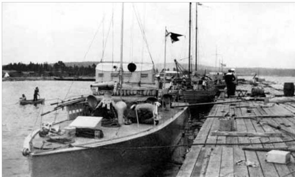
72-футовый катер белой флотилии на Онежском озере. 1919 г.

Очередной ступор подкрался к обалдевшим исследователям сразу после обнаружения на крышке очищенного от обрастаний телеграфа лаконичных надписей «Made in USA». Вскоре стало ясно, что и дру-