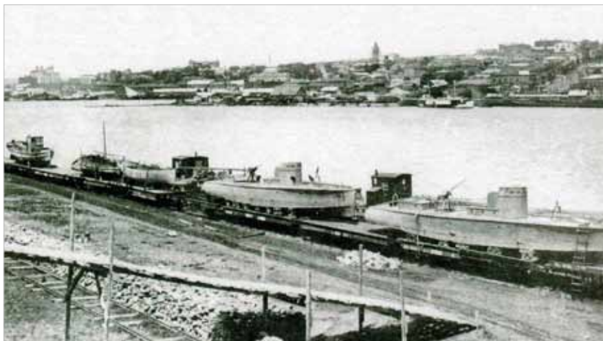
Прибытие «гринпортов» из состава белой флотилии на Волгу, Царицын. 1919 г.

лагали – взорвавшаяся под корпусом мина надежно «сократила» корпус небольшого корабля. Хотя, судя по трехметровой ширине корпуса, длина составляла не более 20–22 метров. Именно ширина обнаруженного корабля с самого начала и вызвала недоумение у всех – ведь «Мошки», как их ласково называли на флоте, да и другие аналоги этих катеров того времени в Советском ВМФ имели ширину корпуса почти 4 метра.