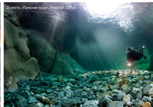
2 место, «Пресная вода», Friedrich Tobias