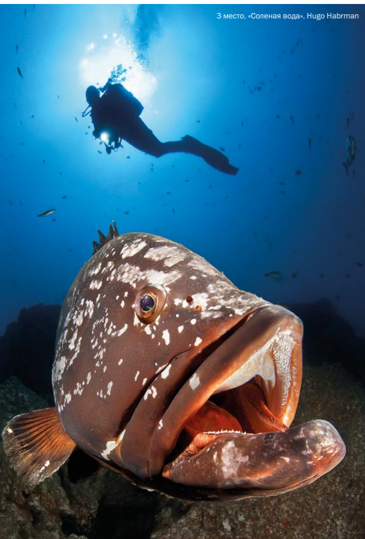
3 место, «Соленая вода», Hugo Habrman