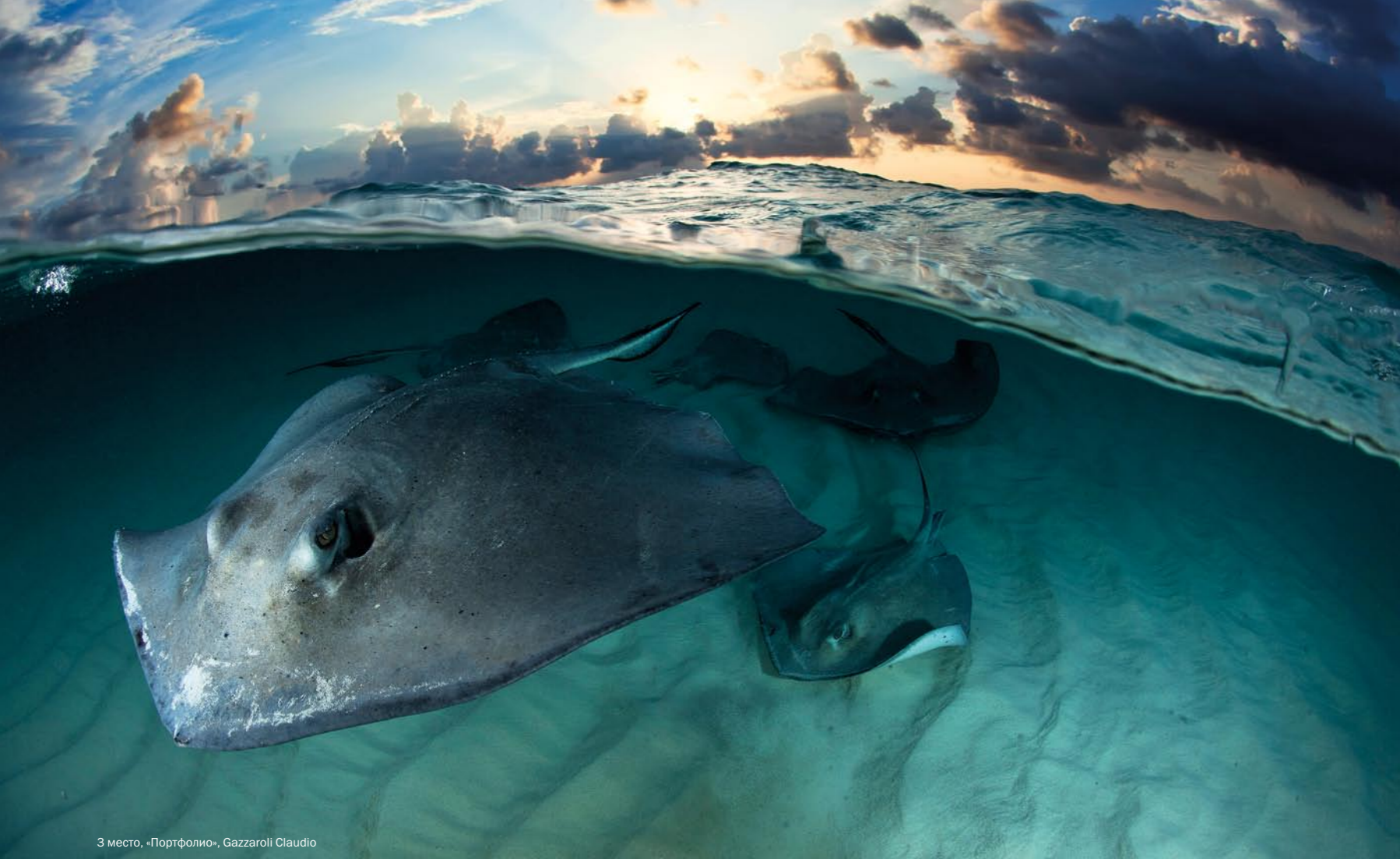
3 место, «Портфолио», Gazzaroli Claudio