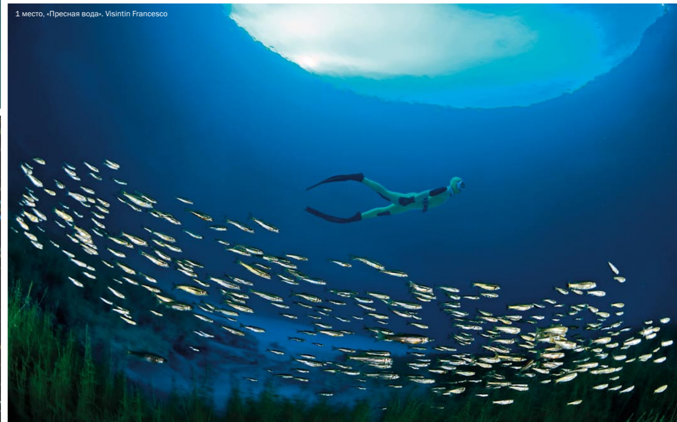
1 место, «Пресная вода», Visintin Francesco