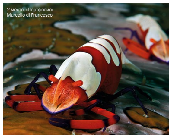
2 место, «Портфолио», Marcello di Francesco