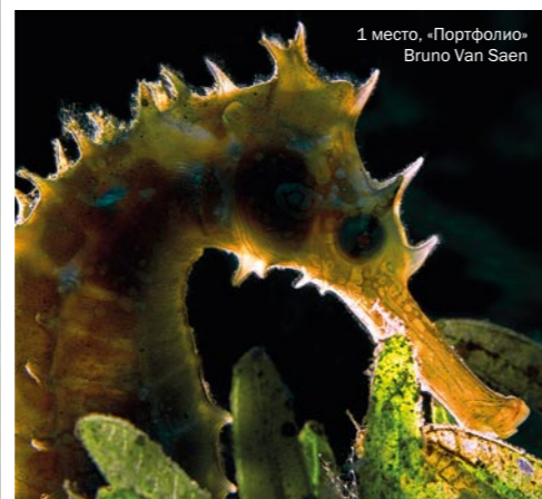
1 место, «Портфолио», Bruno Van Saen