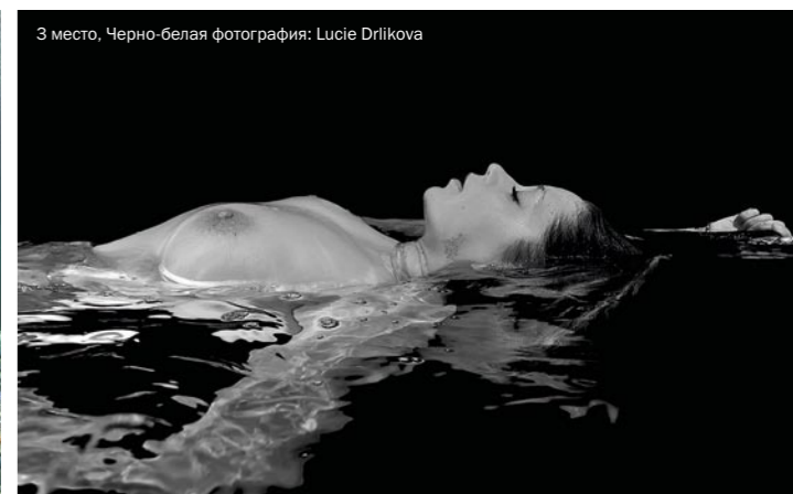
3 место, Черно-белая фотография: Lucie Drlikova